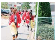
マナー向上 キャンペーン

EXPOエコマネーを発行・活用することで、愛・地球博で高まった環境への関心の持続を図ります。エコマネーはMile Postでのフェアトレード・福祉等の社会貢献活動に対しても発行され、エコマネー利用者の裾野を広げることができます。