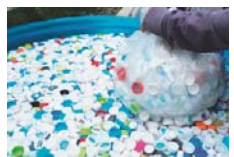
ペットボトル キャップ回収活動

キャップ回収活動のように行動が成果に繋がること、清掃活動のように活動が街に変化をもたらすことを実感して、学生たちが自信を持つようになり、次のエコ活動へと積極的に行動を移すようになりました。